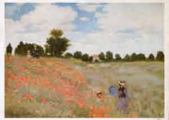
Les coquelicots, Claude Monet 1873