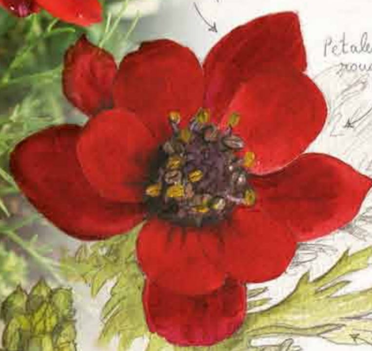
Adonis l'automne ou Goutte de sang